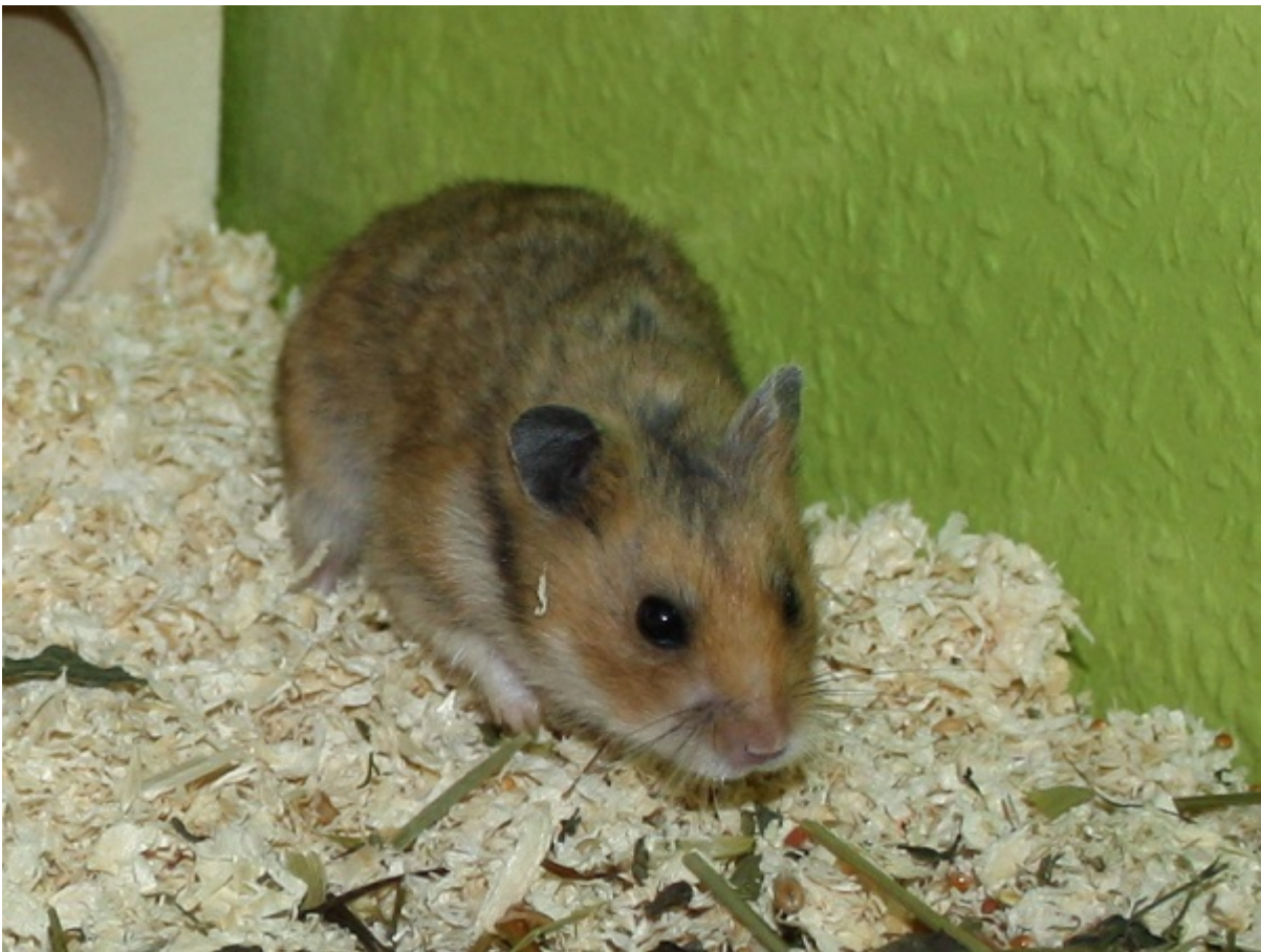
Dorian: RBB 20.03.17