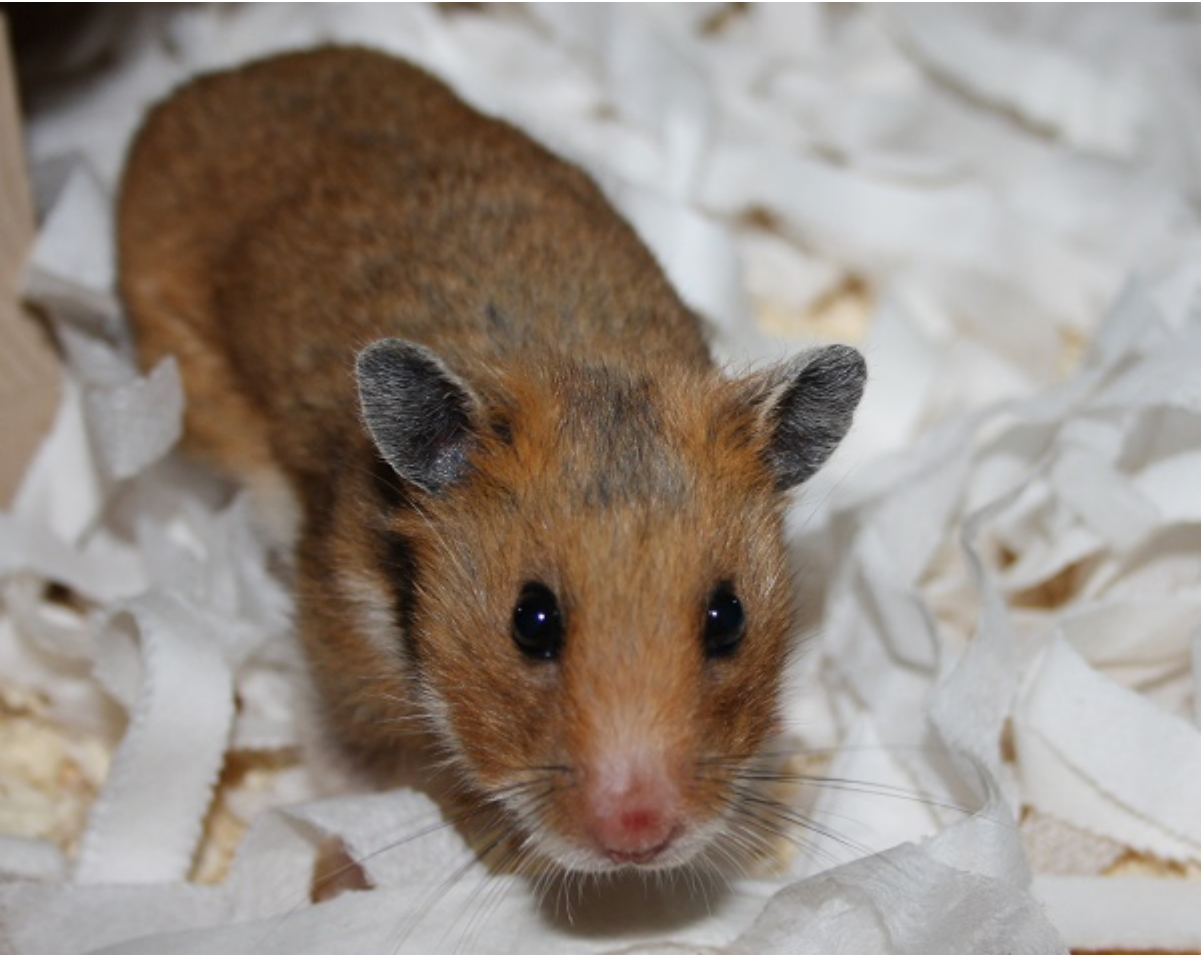
Lala RBB 30.08.16