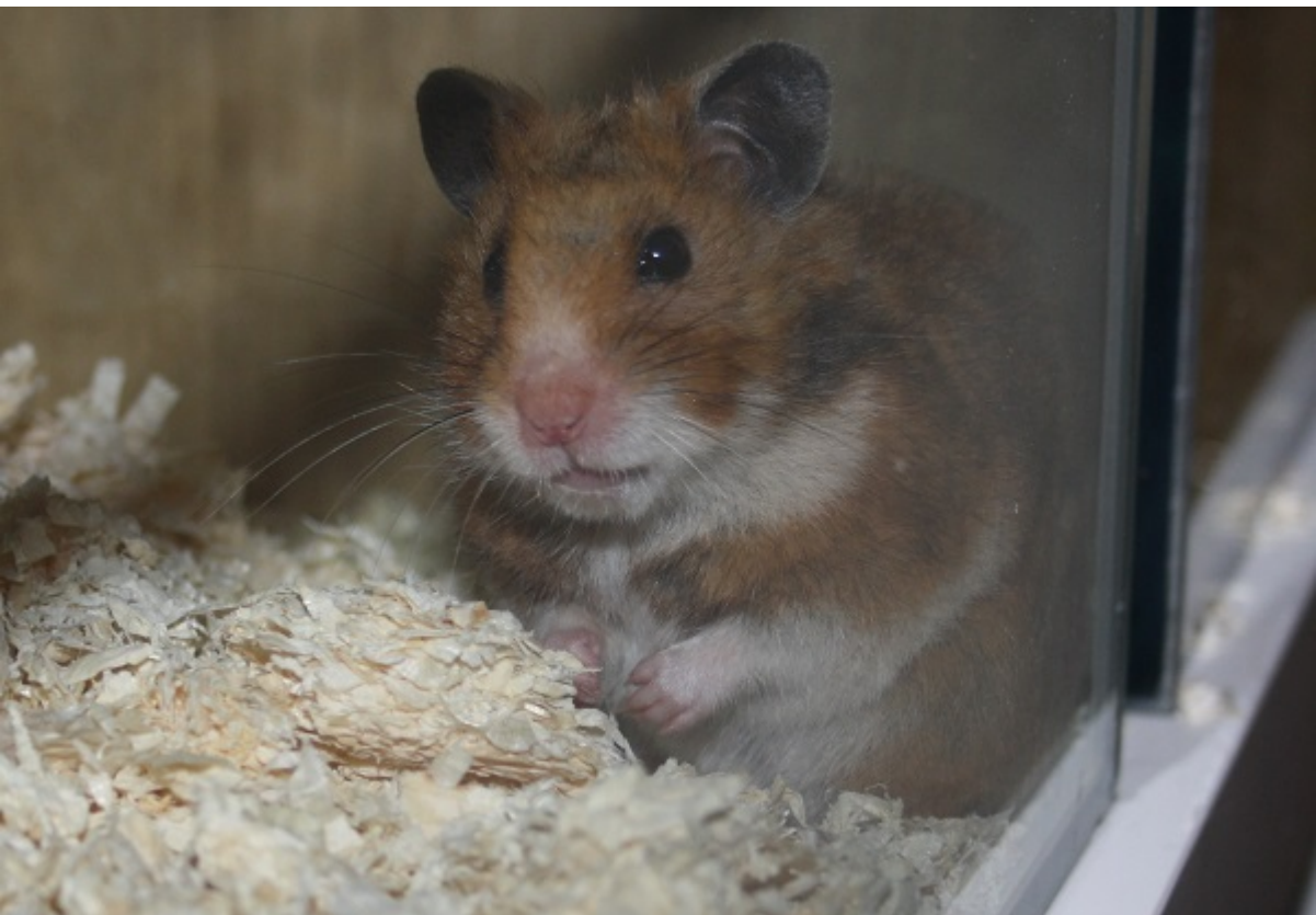
Genna RBB 13.09.16