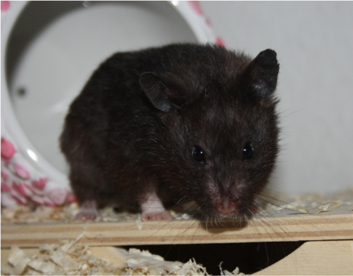
Bis bald, Ireen