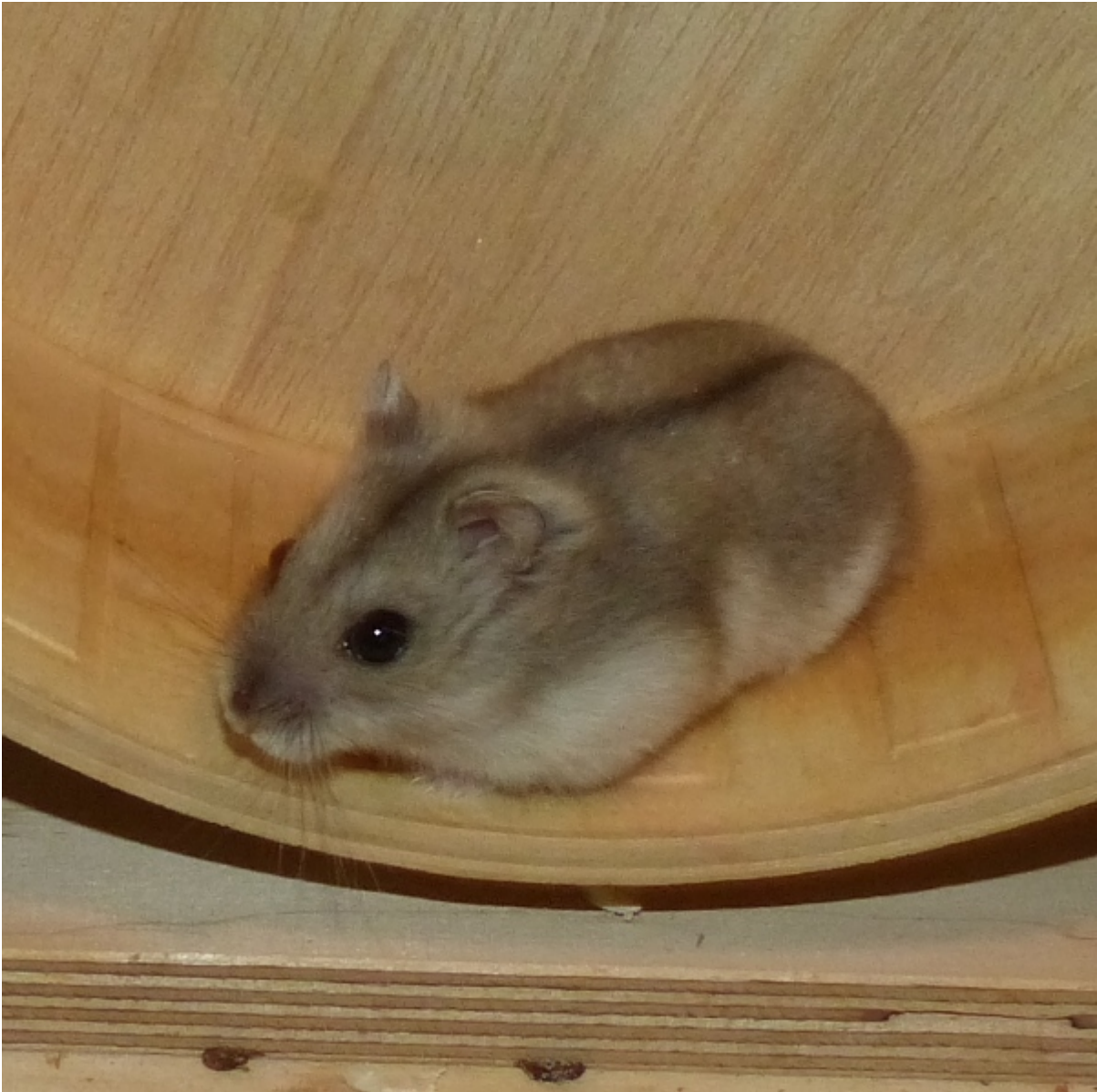
Eines der fünf Winzlinge: