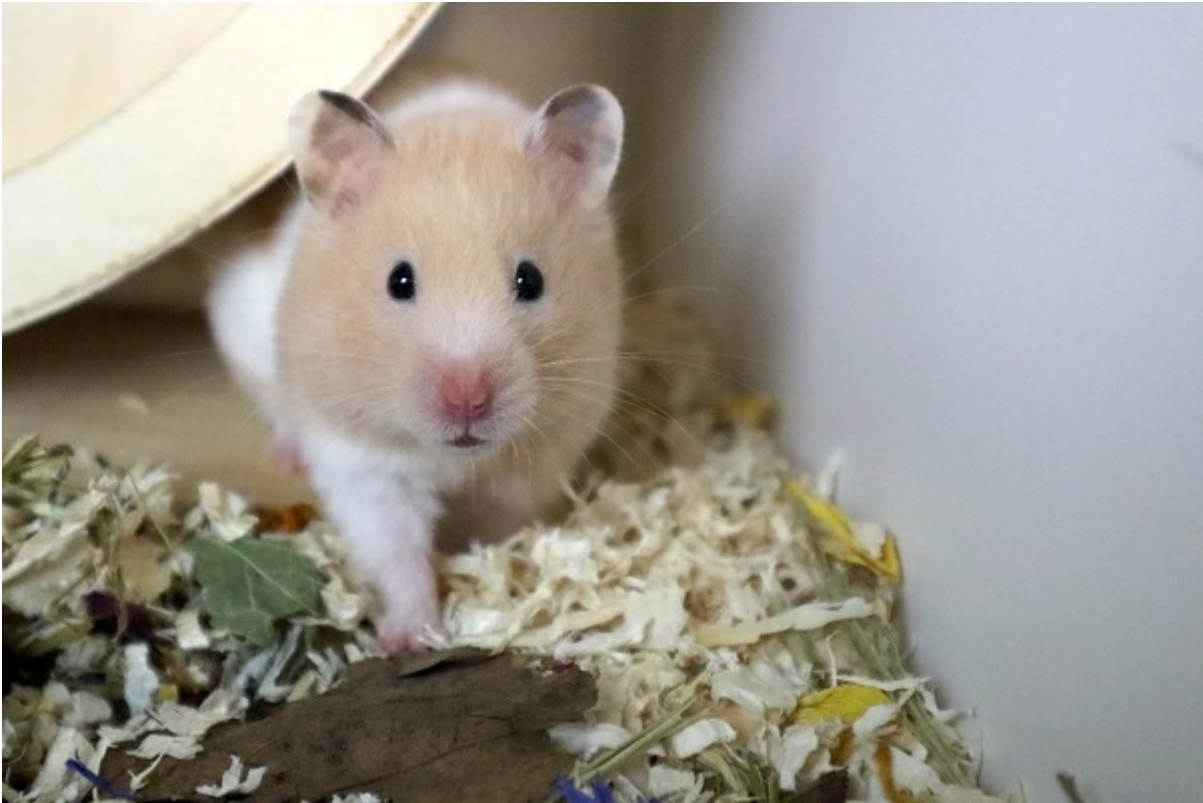
Desna in Gelsenkirchen