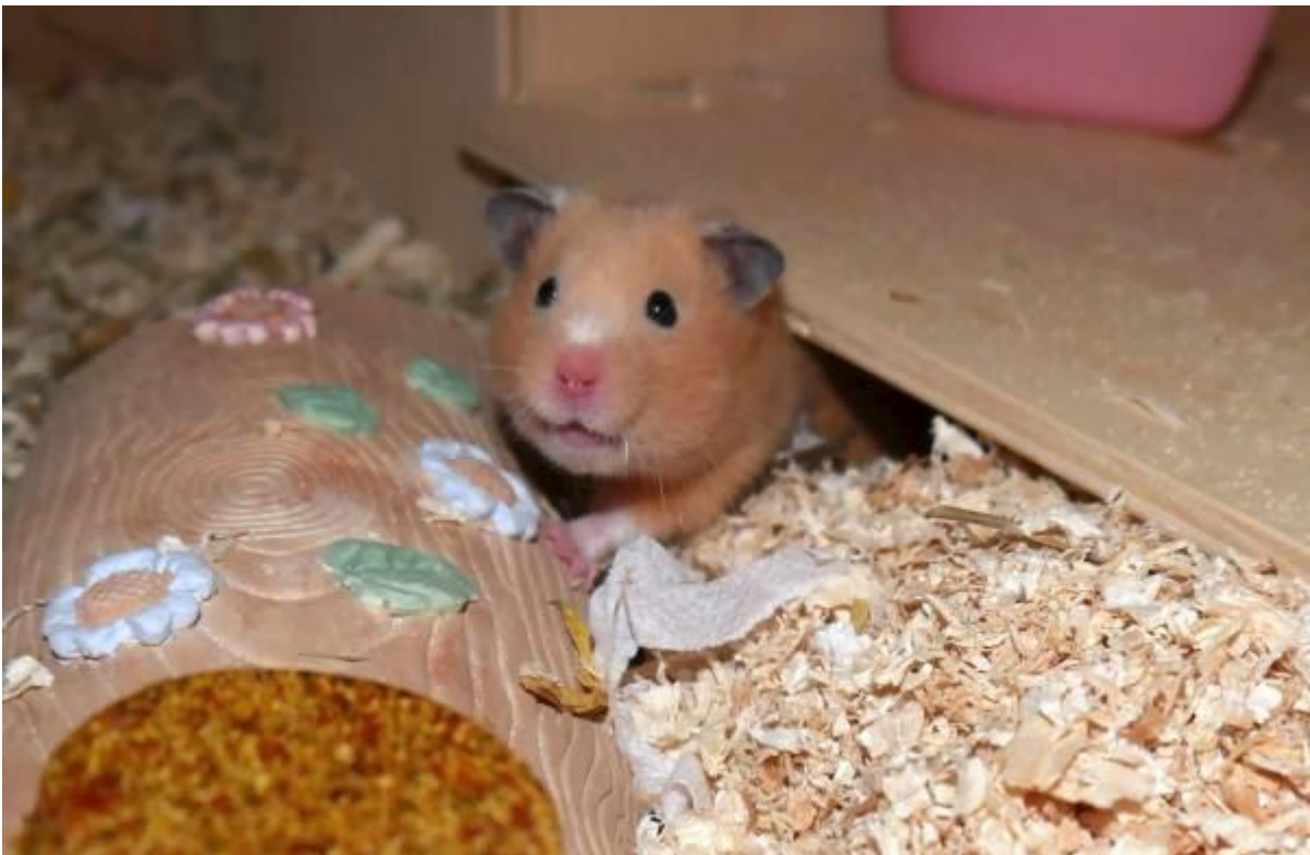
Padau in Marl