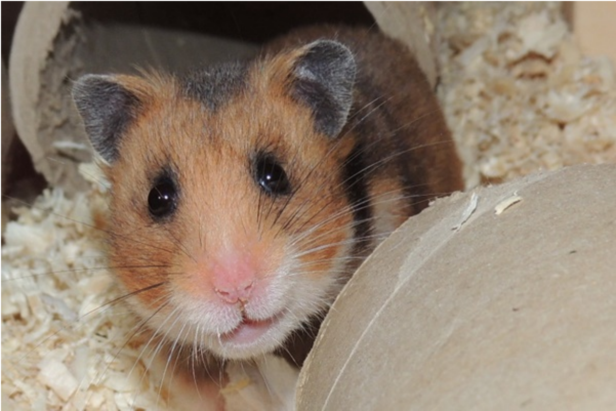
Smilla in Gelsenkirchen