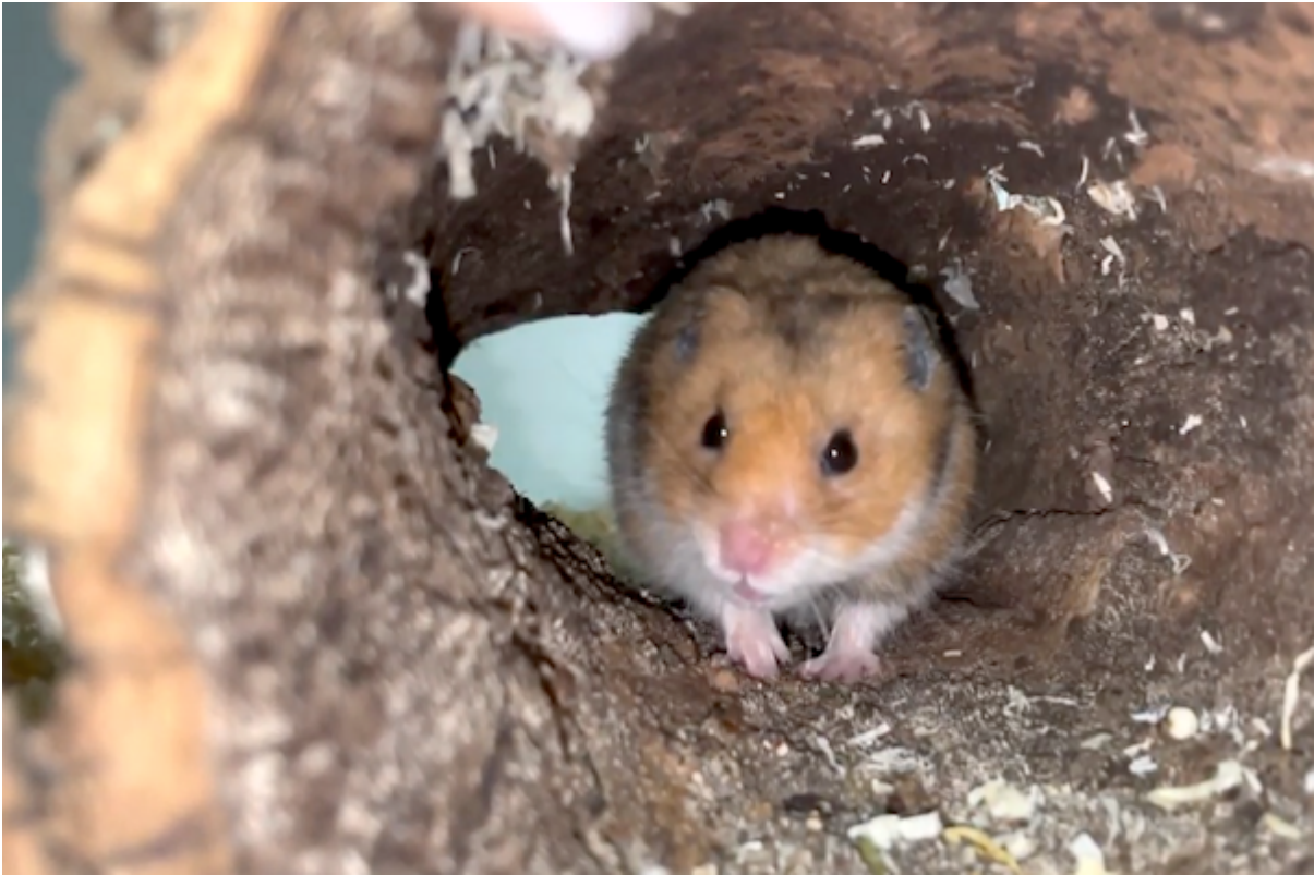
Baku in Witten