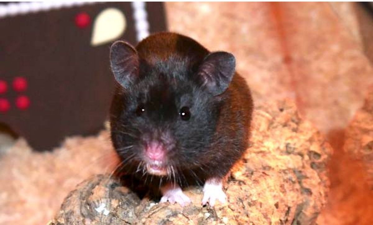
Curt in Lünen