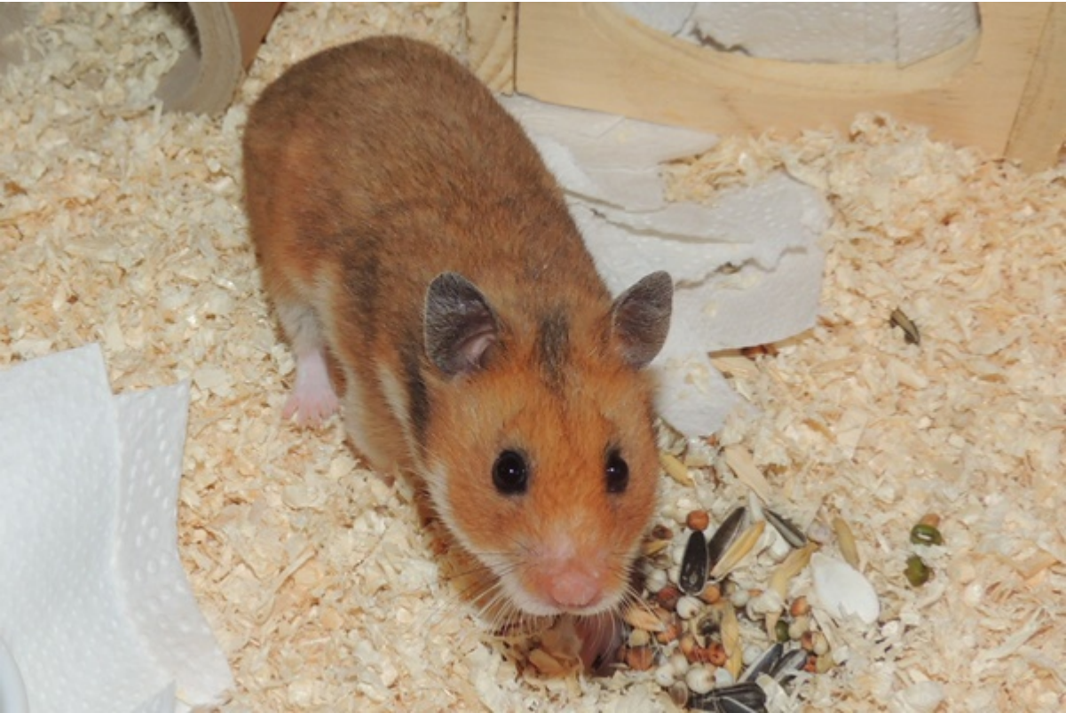
Conzuela in Gelsenkirchen