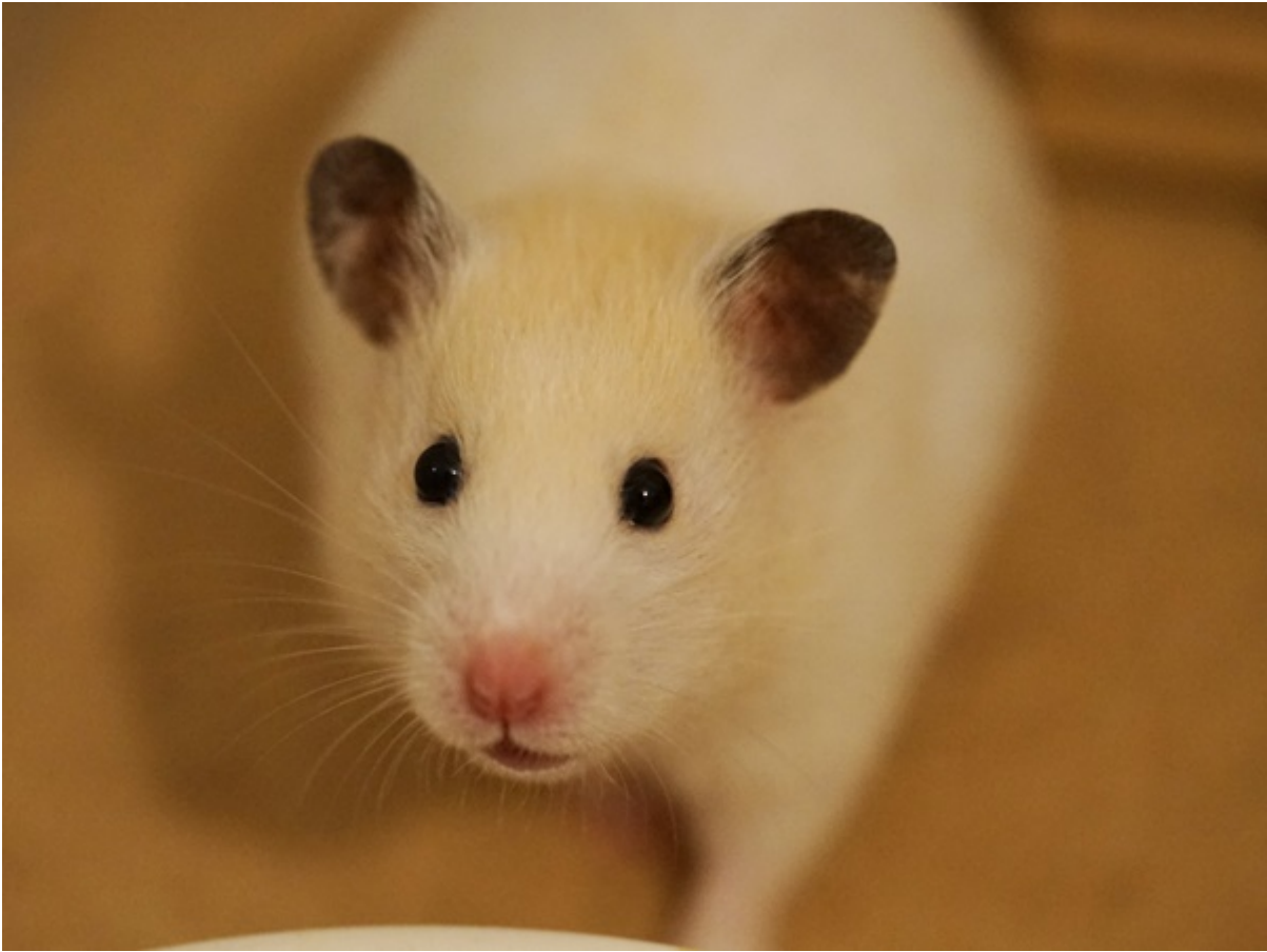
Birga in Köln