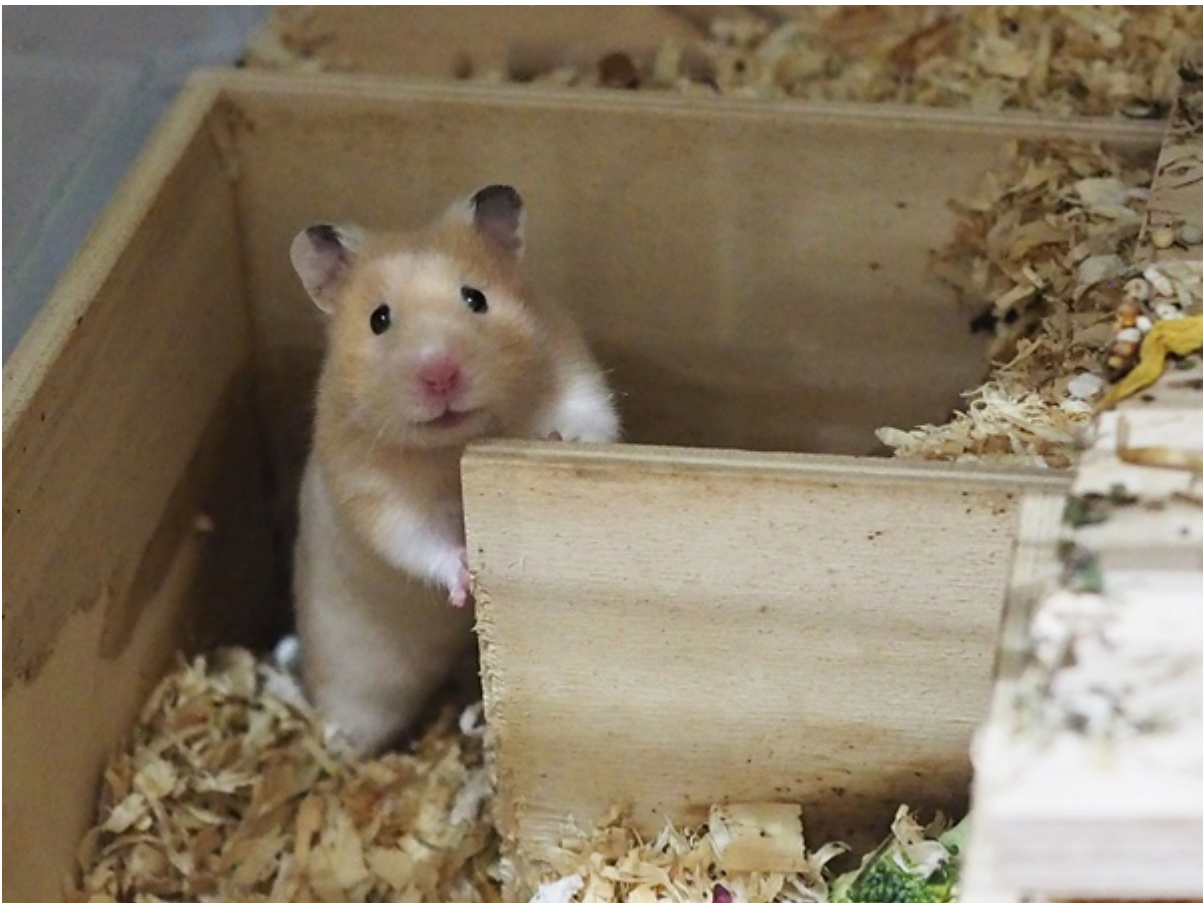
Banju in Marsberg