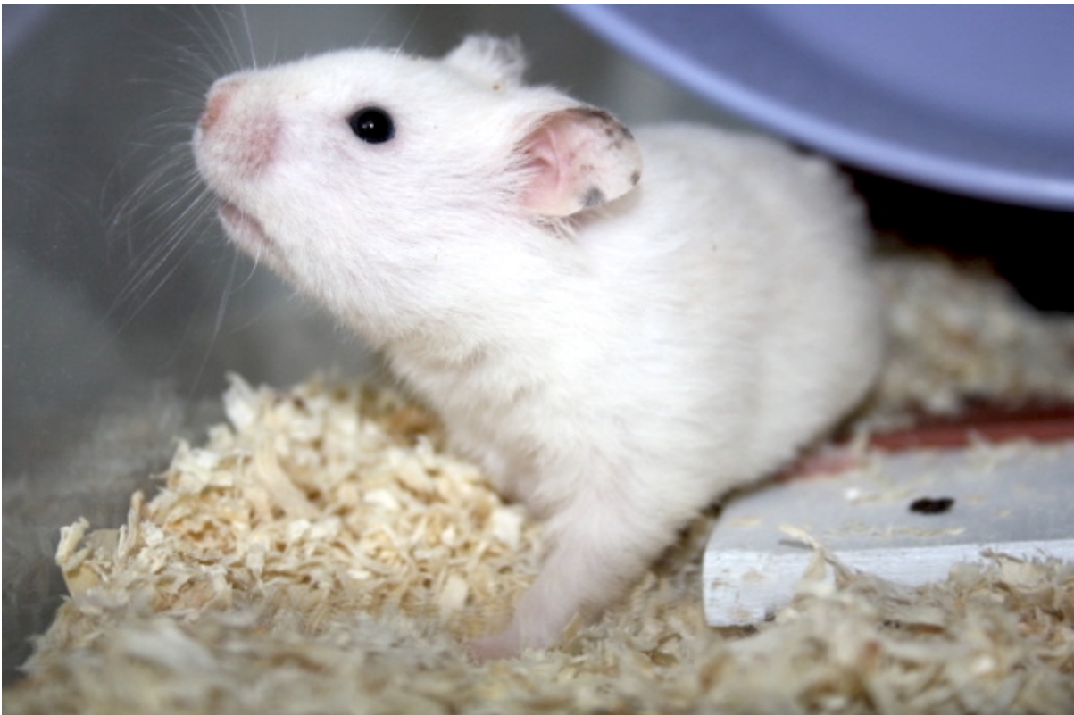
Banju in Marsberg – der zurückhaltende Jüngling