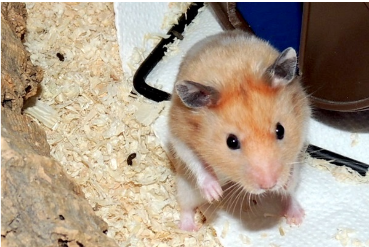
Caesar – Wildfarben Dominant Spot – Abholung in Marl Neugierig aber auch noch etwas schüchtern, derzeit Langschläfer