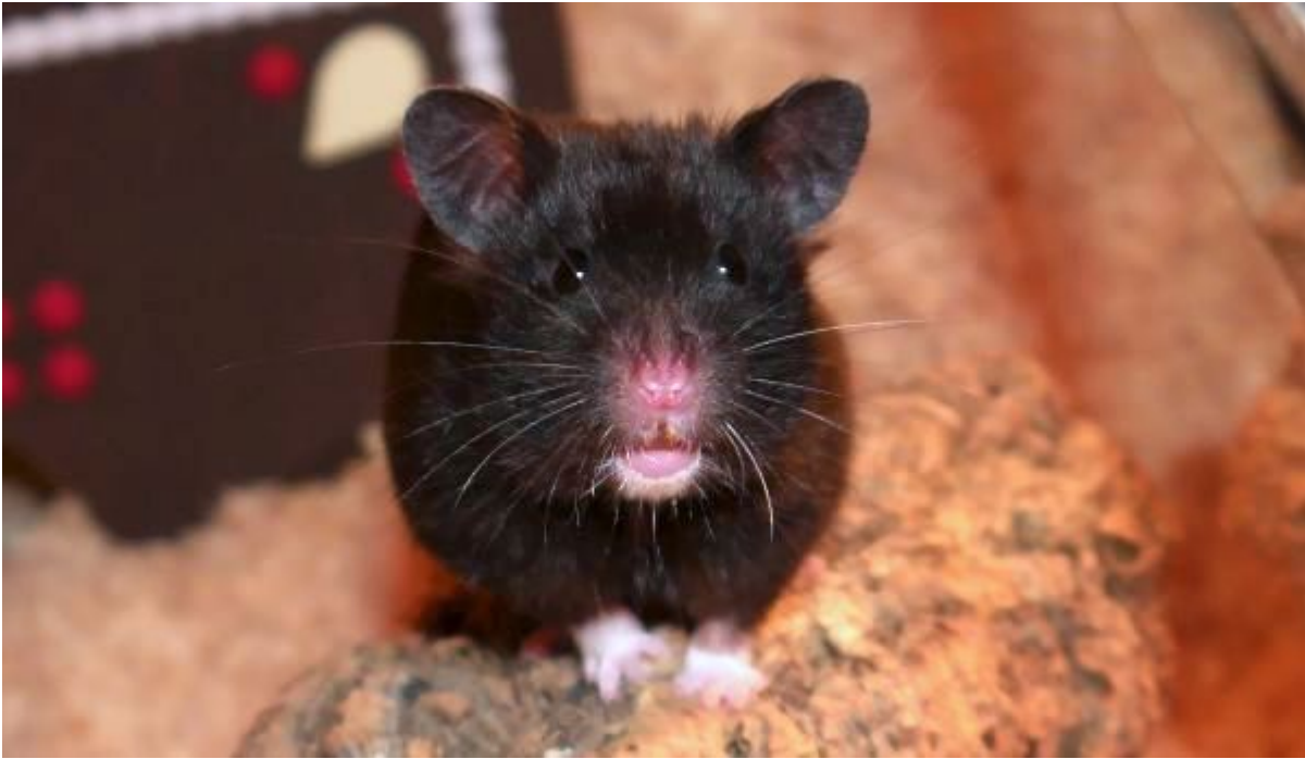
Desmond – Yellow Weißband Satin – Abholung in Marl Schüchterner Knabberkünstler und derzeit Langschläfer