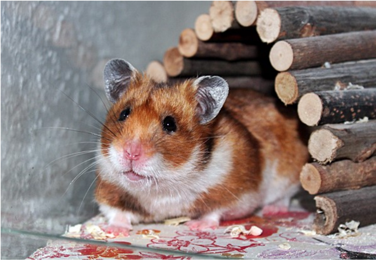
Lucinda in Gelsenkirchen