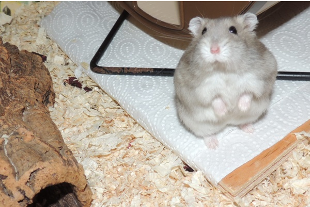
Twinki in Stuhr (bei Bremen)