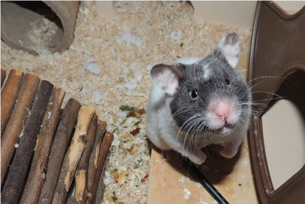
Iirmi in Marl