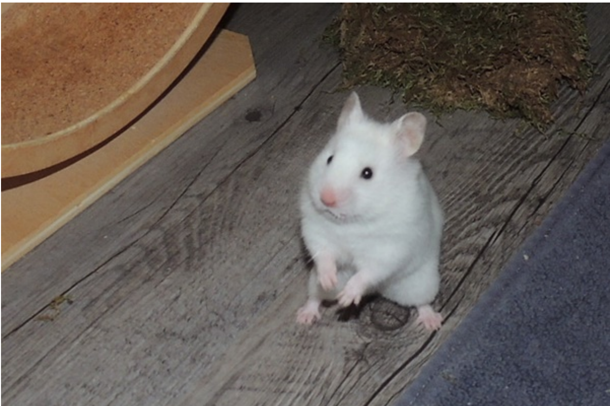
Iska in Marl